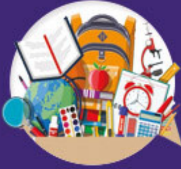
Bourse aux affaires d'occasion