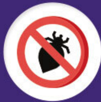
Stop aux poux