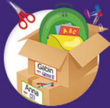
Opération fournitures scolaires

Inscrivez-vous dès aujourd'hui . Échangez, dialoguez et créez du lien entre parents et enfants de votre établissement .