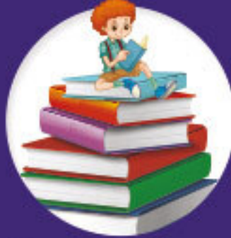
Bourse aux livres